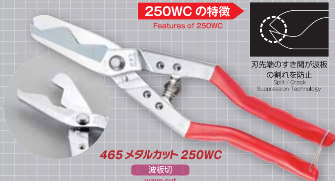
465 メタルカット 250WC

刃先端のすき間が波板 の割れを防止 Split / Crack Suppression Technology