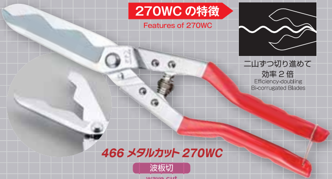
466 メタルカット 270WC

二山ずつ切り進めて 効率 2 倍 Efficiency-doubling Bi-corrugated Blades