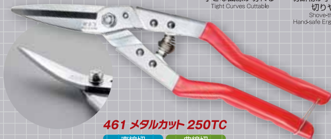
461 メタルカット 250TC

切断物が手に当たらず 切りやすい Shove-through & Hand-safe Ergonomic Design