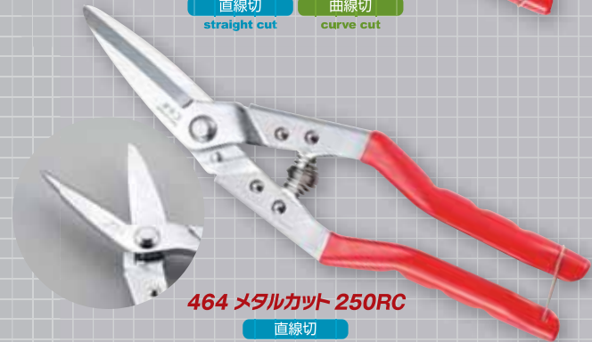
464 メタルカット 250RC