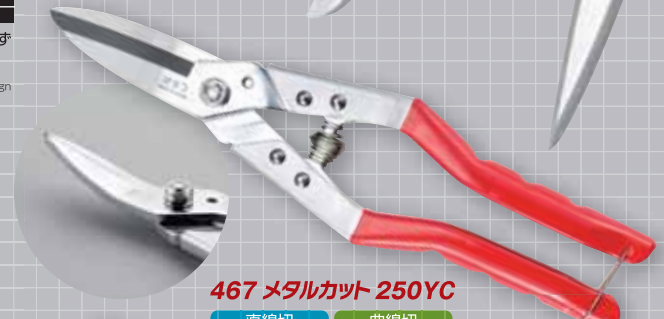
467 メタルカット 250YC