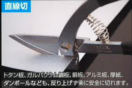
トタン板、ガルバリウム鋼板、銅板、アルミ板、厚紙、ダンボールなども、反り上げず楽に安全に切れます。