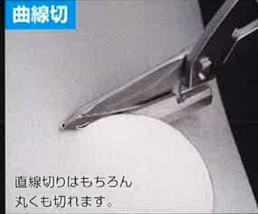
直線切りはもちろん丸くも切れます。