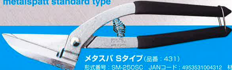
メタスパ Sタイプ (品番: 431) 形式番号: SM-250SC JANコード: 4953531004312 材質/炭素鋼